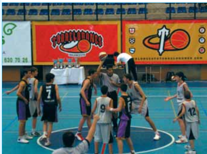
Final masculina categoría infantil preferente