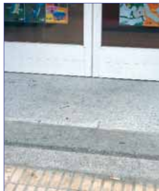
Algunos de los obstáculos: rampas demasiado inclinadas, aceras estrechas y sin rebaje, escalones ...