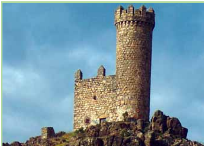
El símbolo de Torrelodones es una torre-vigia del siglo IX