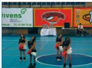
Animadoras del equipo de Torrelodones

El encuentro finalizó con la victoria del Cimaga Torrelodones por 46 a 37 al Real Madrid. Una gran victoria del Cimaga Torrelodones que realizó un magnífico papel. Enhorabuena!