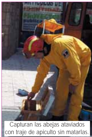
Capturan las abejas ataviados con traje de apicultor sin matarlas.

Desde Protección Civil nos informan de la gran cantidad de llamadas de emergencia que han recibido por este motivo desde la llegada de la primavera. Sólo durante el pasado puente de mayo se realizaron cinco avisos. El panal se forma a una gran velocidad. En general, suelen buscar