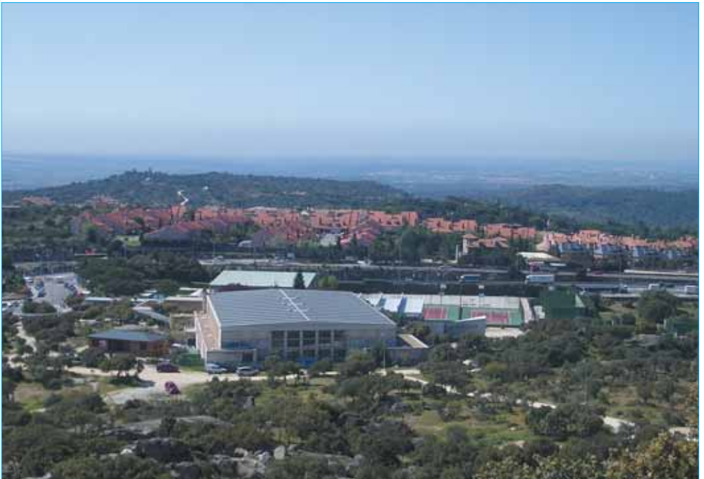
Vista del polideportivo municipal y su entorno

En el año 87 se construye el pabellón grande, pero hay que esperar hasta el 95 para ver la piscina cubierta. De este mismo año son también las dos pistas de squash y las dos de pádel. La última obra en extensión fue en el año 98 con otras dos pistas de pádel. De aquí en adelante las mejoras han sido por dentro, aprovechando mejor el espacio que ya se tenía: salas de aeróbic, más vestuarios, ampliación de la sala de