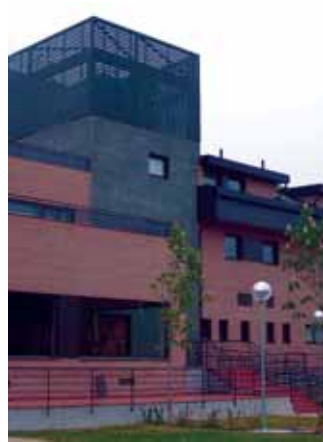
La nueva residencia está en Los Robles

El nuevo centro geriátrico, dotado con amplios servicios y tecnología moderna, fue inaugurado el pasado 28 de abril por el alcalde, Carlos Galbeño. La dirección del centro y el Ayuntamiento han firmado un Convenio cuyo objetivo es la rápida integración de la residencia en el entramado social de Torrelodones. Para lograrlo, se llevarán a cabo iniciativas como facilitar la incorporación de personal procedente del entorno y elaborar planes de formación. Además, otorgará seis plazas de precio reducido a personas designadas por el Ayuntamiento, firmará un Convenio de Concierto de