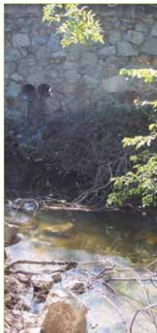
Vertidos directos en la zona Los Jarales

Acabar con los vergonzosos vertidos directos que se vienen produciendo durante los últimos años a los cauces fluviales es uno de los objetivos del Convenio suscrito entre el Ayuntamiento de Torrelodones y el Canal de Isabel II para la mejora de la red de saneamiento en el municipio. De momento han comenzado las obras para la sustitución de los emisarios que trasladan las aguas fecales procedentes de la urbanización Los Jarales, dado su grave estado de deterioro. Esperemos que esta iniciativa de continuidad a otras actuaciones previstas que supondrán, según lo anunciado, "la remodelación total de las canalizaciones de aguas sucias en Los Peñascales, Pueblo y