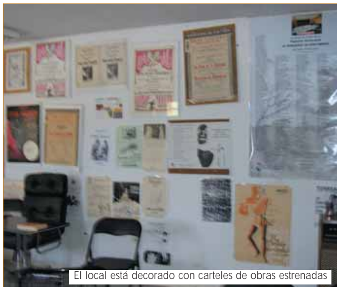
El local está decorado con carteles de obras estrenadas

Bulevar (1987) han estrenado en él todos sus títulos. De hecho, Torrearte fue quién inauguró el teatro con la obra "El retablo jovial" de Alejandro Casona.