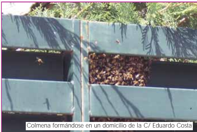
Colmena formándose en un domicilio de la C/ Eduardo Costa

Como curiosidad, contar que el enjambre de abejas está formado por obreras (que pueden llegar a ser miles); una reina que es la madre de todas y un reducido número de zánganos, los machos. La reina pone un huevo en cada celdilla del panal pero, paradójicamente, no es ella la que reina el enjambre. Esta función recae en las obreras, de modo que la reina está sometida a las órdenes de sus propias hijas, que le marcan el ritmo de trabajo (la puesta de huevos). Puede llegar a poner hasta 3.000 huevos al día.