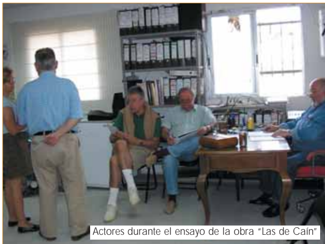
Actores durante el ensayo de la obra "Las de Caín"

Torrearte se creó en el año 1982, con lo que llevan 23 años de trabajo ininterrumpido a sus espaldas. Se creó como una Asociación cultural sin ánimo de lucro, y así empezaron a hacer teatro. Hasta mayo de 2005 han estrenado más de 50 títu-