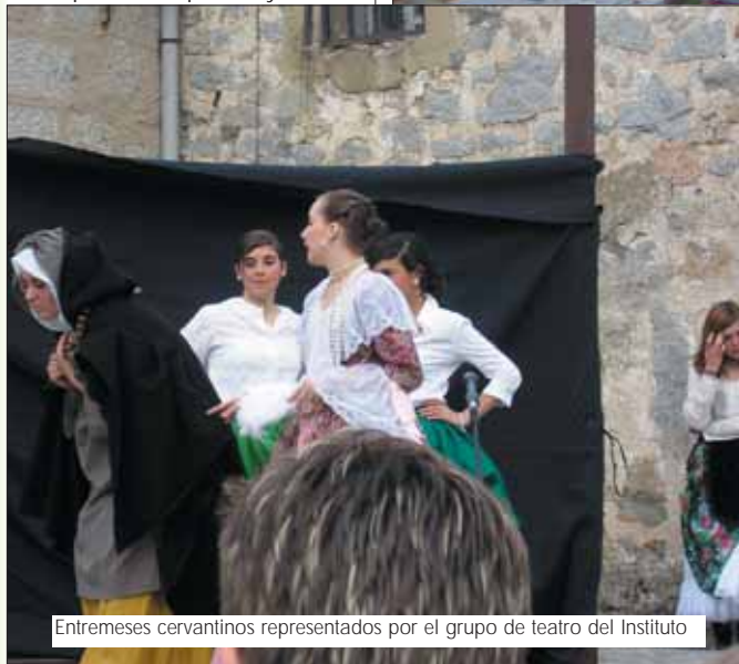
Entremeses cervantinos representados por el grupo de teatro del Instituto

movimiento"y añadía "Este año se están vendiendo sobre todo ediciones infantiles de El Quijote"