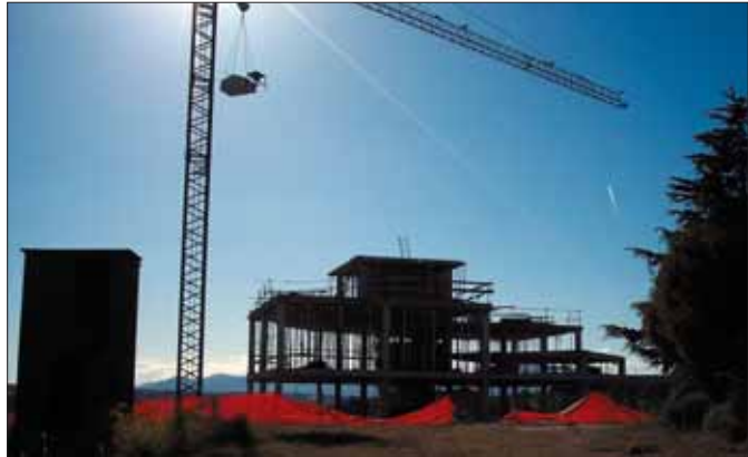
La parcela de las viviendas (abajo) es contigua a la del futuro edificio de seguridad, en construcción (arriba).

La historia de las viviendas protegidas para jóvenes de Torrelodones se remonta al año 97, cuando fueron sólo 8 los afortunados que pudieron beneficiarse de la I Fase del Plan de Viviendas. La selección, en aquella ocasión, fue por un sistema de puntuación que atendía a criterios como la renta de los candidatos, si tenían o no hijos o la intención de formar una familia. El desempate se realizaba