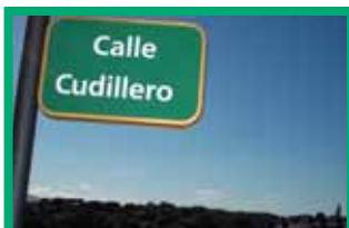
La zona de las futuras viviendas es tranquila y con unas buenas vistas de la Torre.

Todas las solicitudes que cumplan los requisitos participarán en un sorteo público que determinará los adjudicatarios, así como el orden del resto de solicitantes que pasarán a formar la lista de reserva para las posibles vacantes que se pudieran producir entre los adjudicatarios. Las viviendas serán concedidas en régimen de arrenda-