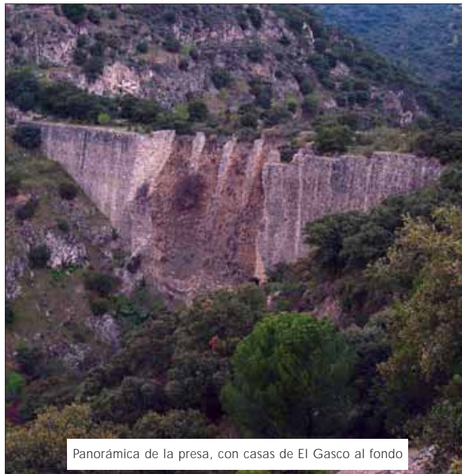
Panorámica de la presa, con casas de El Gasco al fondo

La idea, aunque ahora pueda parecernos quijotesca, no fue suya. Ya Felipe II había intentado canalizar el Tajo hasta Aranjuez, y su nieto Felipe IV había recibido incluso a una flota exploradora llegada desde Lisboa. Pero, en pleno Siglo de las Luces y con Carlos III, apodado "El rey albañil", la fantasía estuvo más cerca de cumplirse. De su reinado datan importantes obras de Madrid como el museo del Prado, la Puerta de Alcalá o la iglesia San Francisco El Grande. El ambicioso plan fluvial, en una época en que las carreteras eran menos que recomendables, consistía en construir un canal navegable de 700 Kilómetros que, partiendo de una presa que habría de construirse a la altura de Torreldones, enlazaría las cuencas de los ríos Guadarrama, Manzanares, Jarama, Tajo, Riansares, Zancara, Jabalón, Guarrizas, Guadalén, Guadalimar, y Guadalquivir. Y de ahí a que Torreldones pudiera bañarse en el Mediterráneo