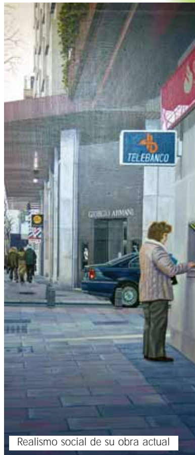
Realismo social de su obra actual

¿Y qué hace este aragonés en Torrelodones? "Vine a Madrid, una ciudad de la que estoy enamorado, para desarrollar mi profesión. Luego, escapando del bullicio de la urbe, cogí la carretera y me encontré con Torrelodones. El pueblo me gustó, y aquí me quedé".