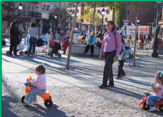
En Torrelorones abundan las parejas jóvenes con niños pequeños.