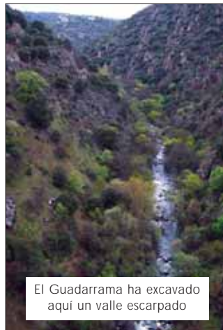
El Guadarrama ha excavado aquí un valle escarpado

A pie: Desde aquí sale un camino de tierra evidente, que rodea una valla y sube un poco hasta encontrarse con otro sendero nivelado, que tomamos a la izquier-