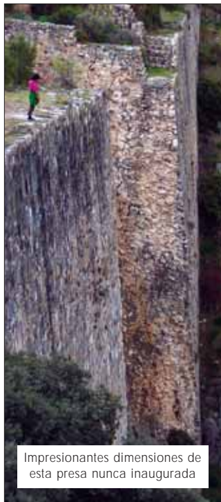
Impresionantes dimensiones de esta presa nunca inaugurada

de estar fuera de Torrelodones y, por tanto, obliga a desplazarse en coche hasta su inicio.