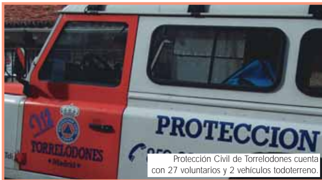
Protección Civil de Torrelodones cuenta con 27 voluntarios y 2 vehículos todoterreno.

La Mancomunidad de servicios sociales THAM está barajando la opción de coordinar sus servicios de Protección Civil. Esta idea se planteó a raíz de las visitas que el coordinador de Protección Civil de Torrelodones y el de Moralzarzal, invitados por la Unión Europea, están haciendo a Bruselas, donde están participando en unos cursos sobre emergencias. Según la alcaldesa de Moralzarzal, Marisol Casado, "todos queremos tener los mejores servicios,