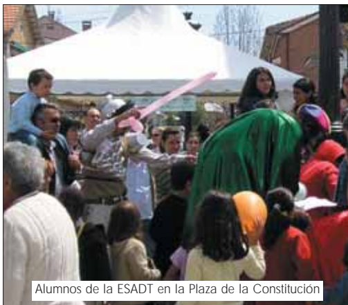
Alumnos de la ESADT en la Plaza de la Constitución

sombra del viento, La Hermandad de la Sabana Santa y la Pasión india.