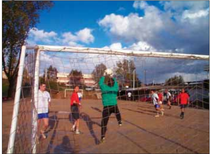
Parada en el último partido de la liga

Para los no iniciados, Minifútbol, tal y como está descrito en su web ( www.minifutbol.com ), es "un campeonato de fútbol que se disputa en un campo de medidas reducidas, abierto a jugadores de todas las edades y sexos, y que está basado en la inscripción individual de los participantes, que pasan a integrarse en diferentes equipos por sorteo". La Asociación Deportiva Minifútbol Torreledones se constituyó legalmente en el año 1998, y desde entonces no ha dejado de crecer. Ya cuenta con más de 200 jugadores, repartidos en las diversas categorías: Nasciturus, Lactantes, Chupeteros, Pavosos, Senior (desde los 18 años en adelante) y la representación femenina en los dos equipos de Mamás.