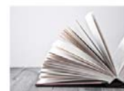
LIBROS DE TEXTO