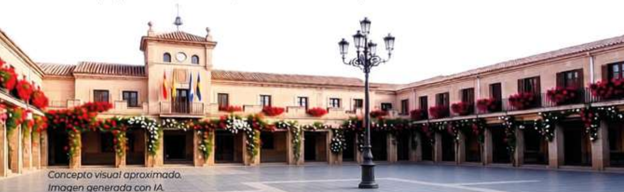
Concepto visual aproximado. Imagen generada con IA.

A esta actuación se suma la obra realizada en octubre para la mejora de la accesibilidad y calidad ambiental, cuya inversión de 136.218,78 euros fue financiada por los fondos NextGenerationEU.