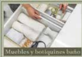
Muebles y botiquines baño

¿Quieres tener un armario organizado por colores y tejidos para lucir como en una revista?