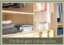
Orden por categorías

¿Tu método de guardar la ropa no te ayuda a mantener el orden en el armario?