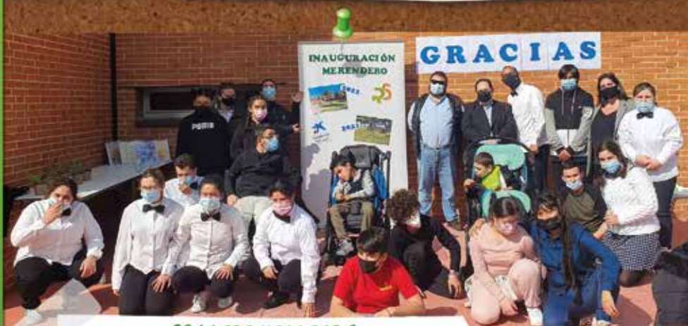
COLLADO VILLALBA Colegio Peñalara, un lugar muy especial