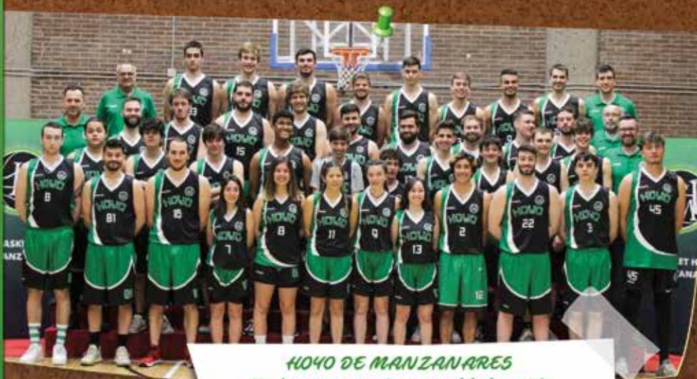
HOYO DE MANZANARES Un buen momento para el baloncesto