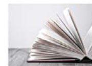
LIBROS DE TEXTO