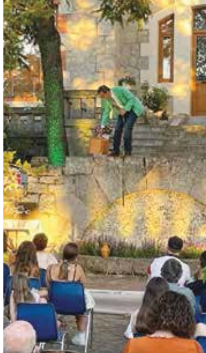
Espectáculo al aire libre en La Solana, Torrelodones

El Ayuntamiento de Alpedrete también tiene preparada una variada y completa programación cultural al aire libre para este verano 2021, con propuestas gratuitas y para toda la familia, y pensadas para evitar aglomeraciones, por lo que se apuesta por ocupar espacios al aire libre como la Plaza de Francisco Rabal, frente al Centro Cultural. Así, las noches de los sábados llegan cargadas de buena música y espectáculos para todas las edades,